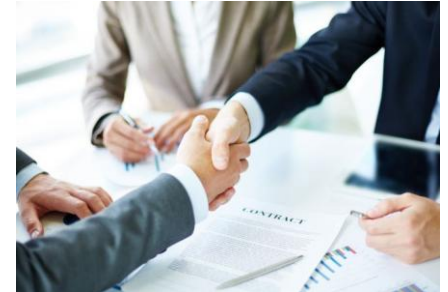
Parengta pagal lpsk.lt informaciją

Telšiuose – po vieną. VDI Utenos, Marijampolės ir Tauragės teritorinius skyrius aptarnauja atitinkamai Panevėžio, Kauno ir Telšių darbo ginčų komisijos. Prašymus išnagrinėti darbo ginčą galima pateikti bet kuriame teritoriniame VDI skyriuje – esant reikalui jis bus persiustas reikiamai darbo ginčų komisijai.